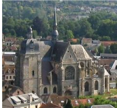
Die Kirche St Sulpice