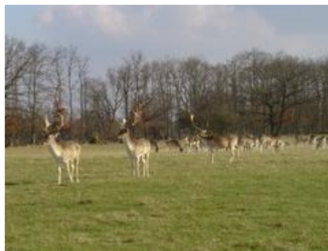
Damwild im Park des Schlosses

Unauffällige Sportanlagen (Golf, Tennis, usw.), Bereiche zum Picknicken, ein Tiergehege sowie Spielbereiche für Kinder haben diesem wertvollen Ort Leben verliehen und erfreuen Besucher jeden Alters.