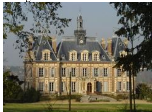
Das Schloss von Nogent-le-Roi in seiner heutigen Gestalt