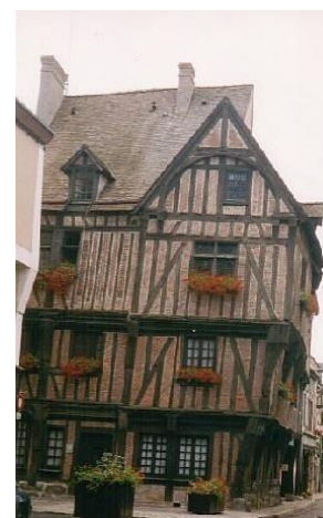
Die sogenannte Maison de l'Obrador

Das Stadtzentrum, maßgeblich von der Vergangenheit geprägt, hält eine Vielzahl architektonisch bemerkenswerter, zwischen dem 15. und 16. Jahrhundert erbauter Häuser bereit. Besonders hervorzuheben ist hierbei ein Rundweg, der ausgehend von der Maison de la Fleur de Lys an der Maison des Évêques vorbeiführt. Weiter hinten die sogenannte Maison de l'Obrador , auch unter dem Namen Maison de Diane bekannt in Anspielung auf Diana von Poitiers, der Witwe des Lehnsherren von Nogent-le-Roi, Louis de Brézé.