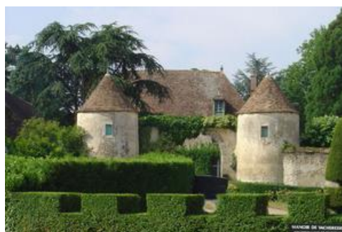
Das Herrenhaus von Vacheresses-les-Basses

Der Eingang sticht nicht zuletzt aufgrund zweier Wachtürme, die das Eingangsportale flankieren, hervor. Seine imposante Erscheinung führt dem Spaziergänger die Kraft und Schlichtheit der mittelalterlichen Bauweise vor Augen.