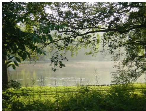
Der See von Bréchamps

Ist man zu Fuß auf den Wanderwegen längs der Eure unterwegs, so präsentieren sich bei jeder Flussbiegung landschaftlich neue Eindrücke. In einen Kranz aus Bäumen und Gehölzen eingebettet, verstecken sich die Seen von Bréchamps, Lormaye und Villiers le Morhier.